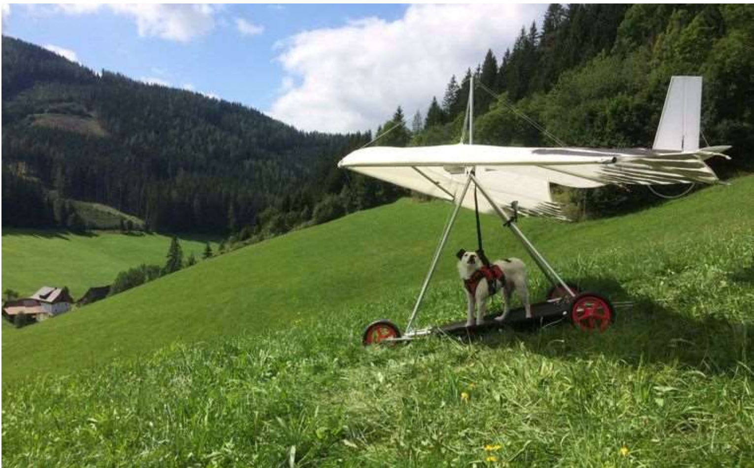
Chayka met de deltavlieger.