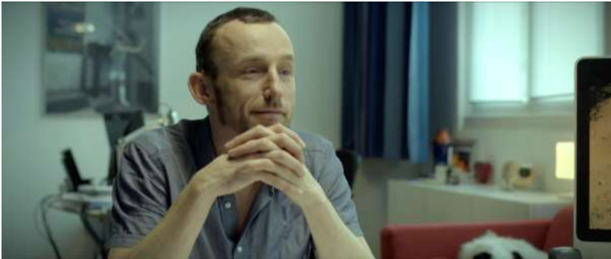
Regisseur Johannes Hogebrink

Deze film is gerealiseerd met steun van het Nederlands Filmfonds, de Netherlands Film Production Incentive, ORF Film/Fernseh-abkommen, het Cinestyria Film Commission and Fund, en CineCrowd.